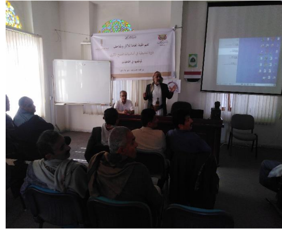
افتتاحية الدورة التثقيفية من رئيس الهيئة