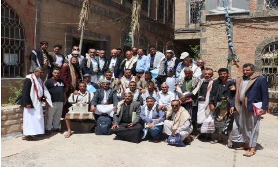
صورة جماعية للمتدربين والمحاضرين واللجنة التحضيرية والاخوة الضيوف