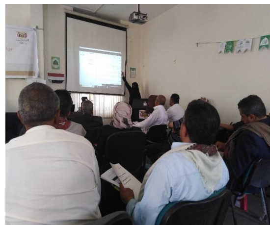
المحاضرة الرابعة من برنامج الدورة