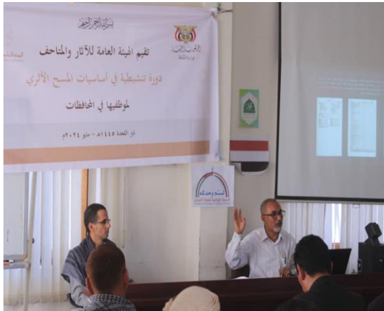
المحاضرة الثالثة من برنامج الدورة