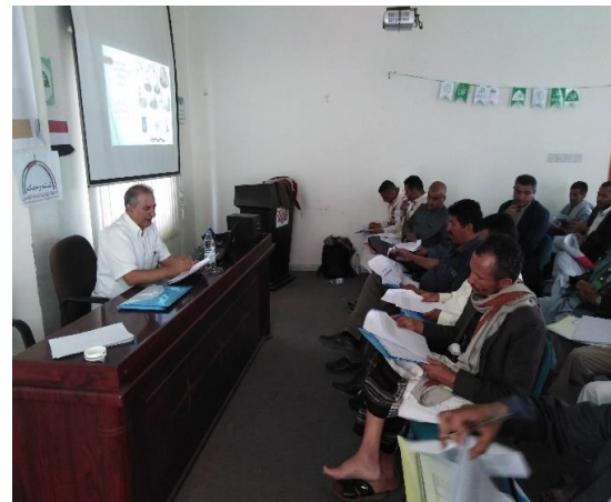
المحاضرة الثانية من برنامج الدورة