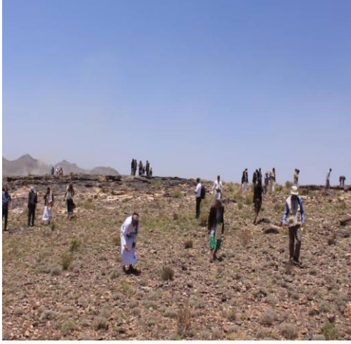
جانب من النشاط الميداني المتمثل في تطبيق المسح الأثري الأرضي في الميدان وجمع العينات