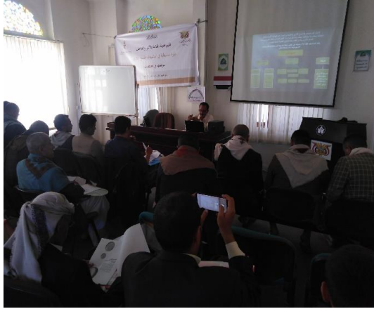
المحاضرة الاولى من برنامج الدورة