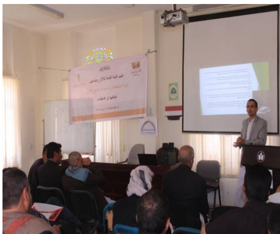
المحاضرة الخامسة من برنامج الدورة