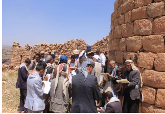
أثناء تسجيل وصف المعلم الأثري (حصن منيف)