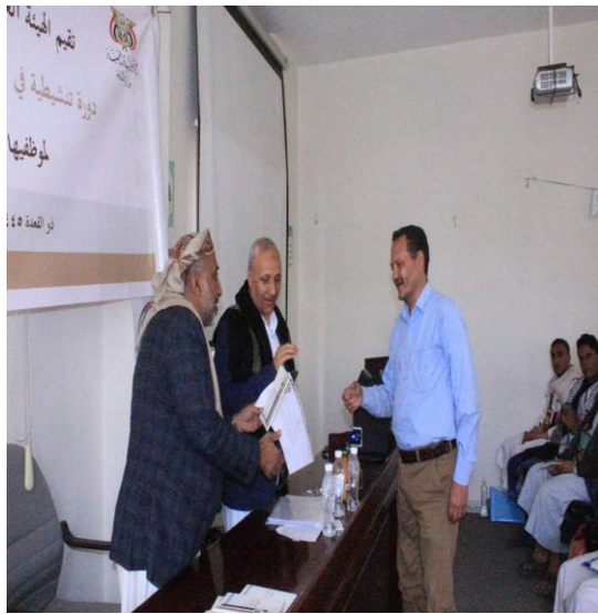
تكريم وتسليم الشهادة التقديرية لاحد المحاضرين في الدورة