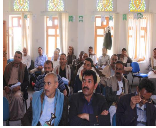
المتدربون أثناء الاستماع لاحد المحاضرات