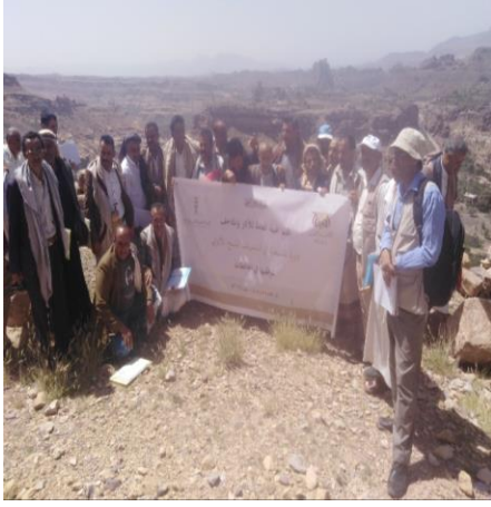
المتدربون في موقع التدريب الميداني